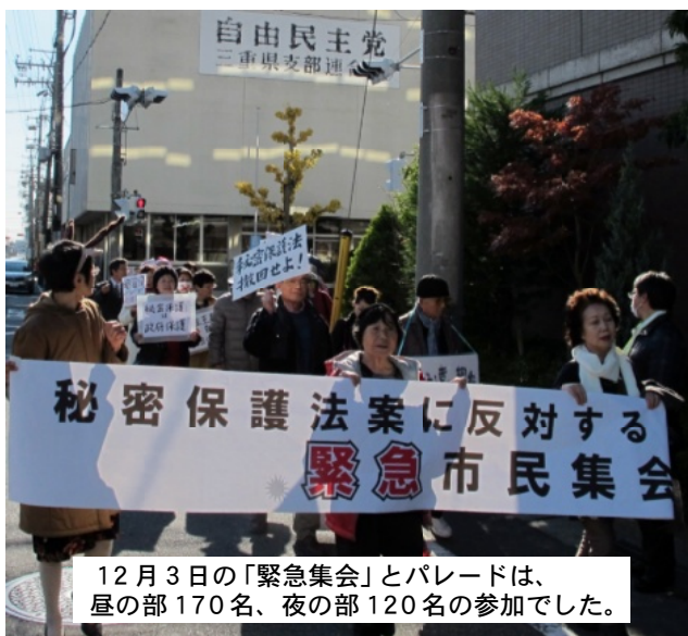
12月3日の「緊急集会」とパレードは、 昼の部170名、夜の部120名の参加でした。